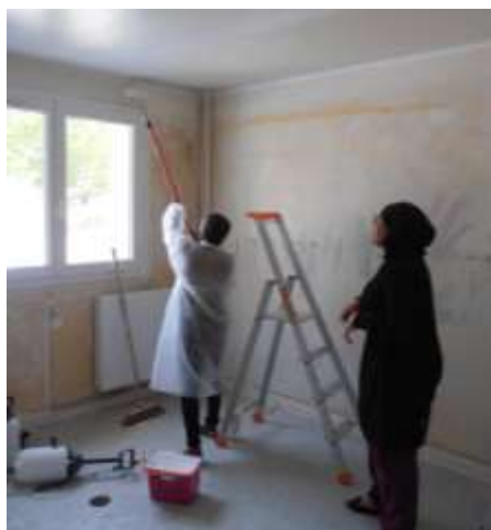
Chantier d'Auto-Réhabilitation du local des bleuets - Valence