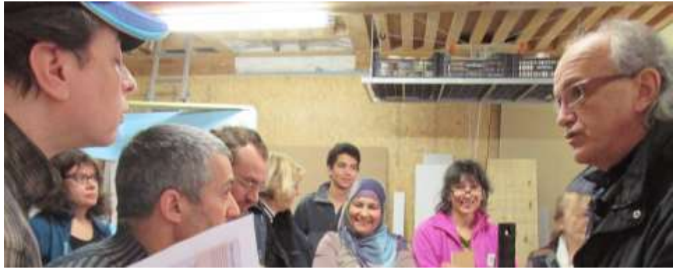
Atelier bricolage fabrication et pose de peinture écologique Lyon 1er