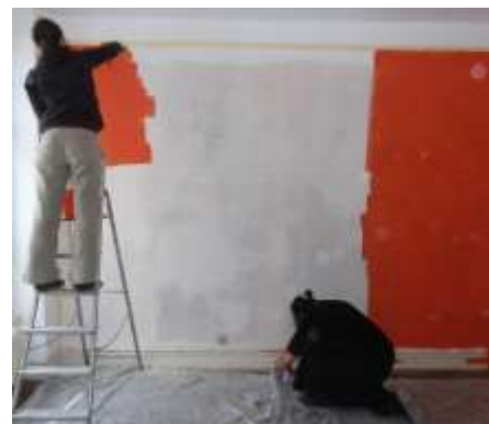
Chantier d'un bénéficiaire - Lyon 1 er

Les CBRA participent aux projets du réseau Compagnons Bâisseurs animés par l'Association Nationale en particulier sur l'ARA auprès des propriétaires occupants et sur le développement du bénévolat dans les associations. Ils se sont également impliqués dans la concertation lancée par le ministère du logement sur les conditions du déploiement de l'ARA. Les CBRA ont participé à l'organisation de l'Assemblée Générale de l'ANCB qui s'est tenue à Lyon en juin 2013.