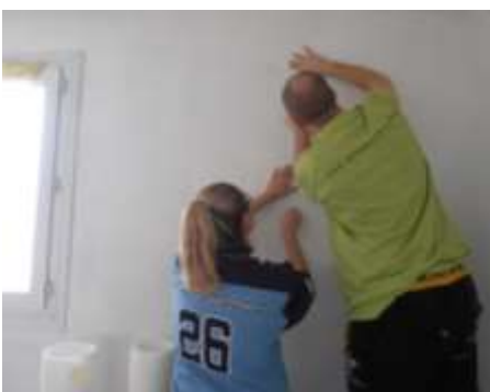
Habitante, sur son chantier - Valence

Le Conseil Général de la Drôme, intéressé par la démarche d'auto-réhabilitation accompagnée, en particulier par les effets indirects qu'elle peut avoir sur les rapports