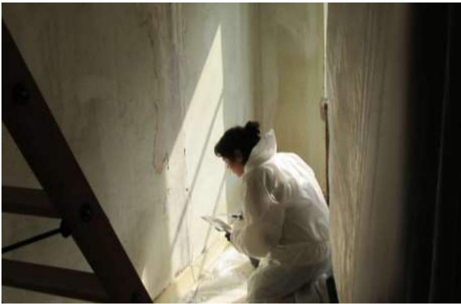
Bénévole sur le chantier d'un propriétaire occupant à Lyon.