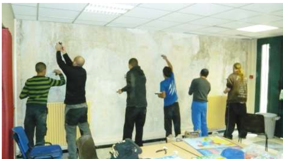
Bénévoles, volontaires et bénéficiaires en chantier

L'association des « Compagnons Bâtitisseurs Rhône-Alpes » a été créée en décembre 2010 et a démarré concrètement son activité en septembre 2011. Depuis cette date, plus de 80 chantiers d'auto-réhabilitation accompagnée ont été réalisés. Les CBRA sont déjà implantés dans trois départements : Rhône, Isère et Drôme et les actions en cours de réalisation ou en projet foisonnent, comme le raconte ce rapport d'activité pour l'année 2013. Tout cela est porté aujourd'hui par une équipe de huit salariés (appelée à s'agrandir dans les prochains mois), trois jeunes volontaires et plus de trente-cinq bénévoles actifs dans les chantiers, l'animation et la gouvernance de l'association.