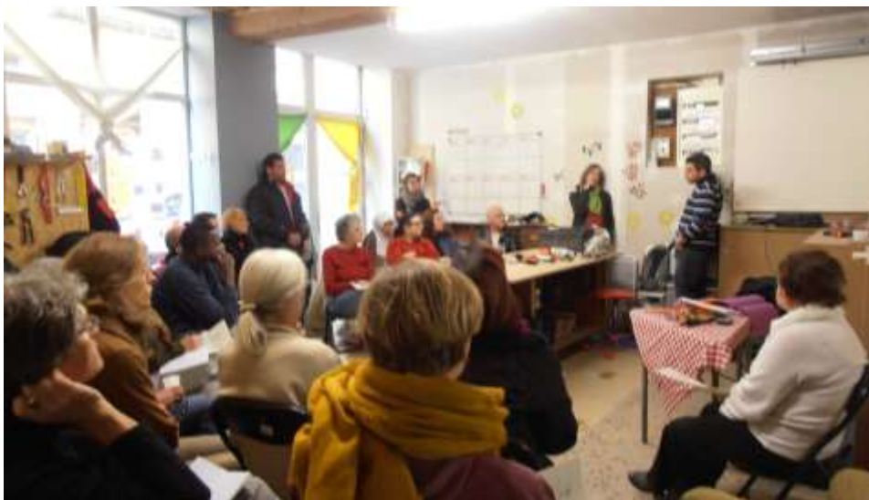
Atelier bricolage animé par un bénévole électricien

Impulsé en 2012, le plan d'action bénévolat a pris son envol en 2013. Plus de 35 bénévoles sont aujourd'hui impliqués dans l'association (chantiers solidaires, animations des ateliers de bricolage et de l'outilthèque, communication et gouvernance...).