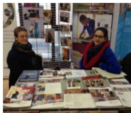
Festival Economie Sociale et Solidaire - Bourgoin Jallieu