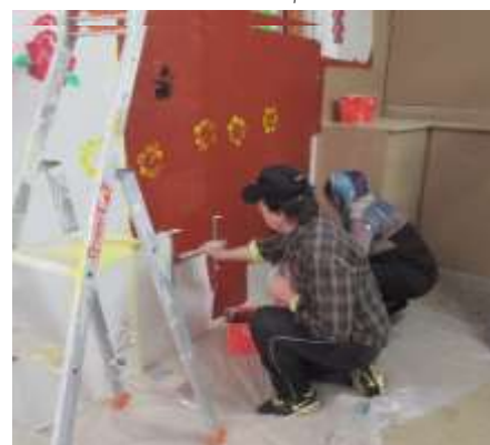
Atelier bricolage sur la peinture écologique