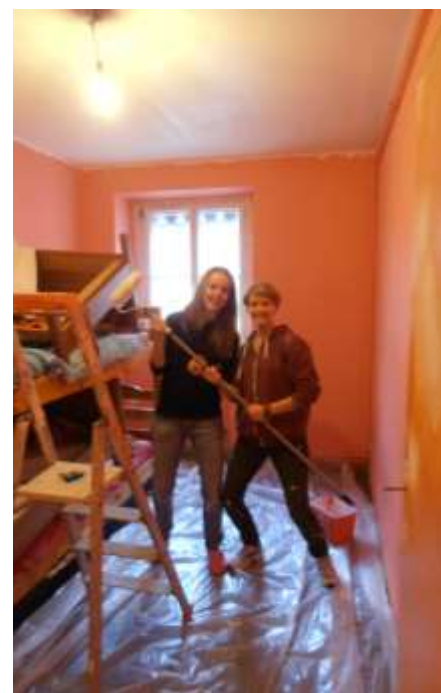
Bénéficiaire et volontaire sur un chantier.

2013 est la 2 ème année d'accueil de jeunes volontaires en service civique. Ils sont désormais trois, de France et d'Allemagne, logés par l'association, à participer aux chantiers d'ARA, à la dynamique collective et solidaire des projets, à la vie associative des CBRA et du réseau Compagnons Bâtisseurs (participation aux instances régionales et nationales, stage des volontaires, mobilité dans d'autres associations régionales ...). Leur implication, leur jeunesse et leur enthousiasme constituent une véritable valeur ajoutée pour l'équipe et les projets.