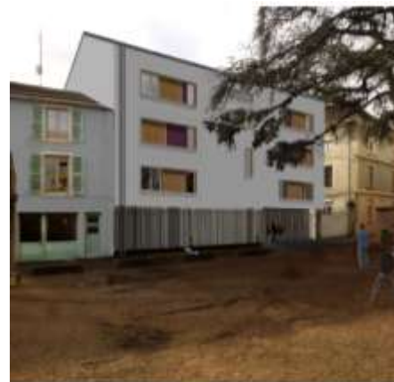
La façade nord du futur bâtiment