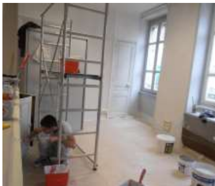
Chantier de rénovation du local - Bourgoin Jallieu

pour former techniquement une de ses animatrices à la réalisation et à la conduite des chantiers avec les bénéficiaires. Celle-ci travaille en binôme avec une conseillère sociale à La maison des habitants , un centre social communal. Ce projet cible la lutte contre l'isolement dans l'ensemble du parc public HLM de la ville.