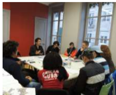
Réunion de définition du projet architectural avec une partie du groupe de jeunes

Le CCAS de Bourgoin-Jallieu a décidé, dans le cadre de son nouveau projet d'Auto-Rénovation Accompagnée, de faire appel aux Compagnons Bâtitseurs Rhône-Alpes