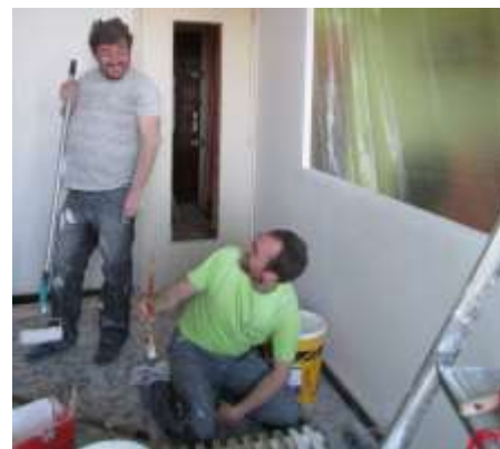
Un bénéficiaire propriétaire-occupant sur son chantier.

La phase expérimentale se poursuit au premier semestre 2014 pour aboutir à la signature d'une convention de Programme d'Intérêt Général d'ARA dans le Parc Privé.