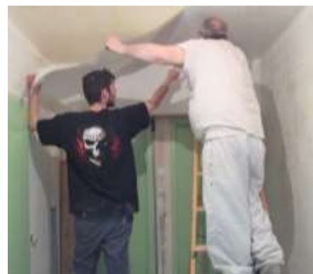
Bénéficiaire et bénévole en chantier.