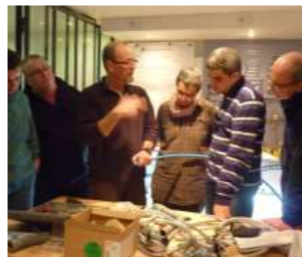
Formation de 8 bénévoles à la plomberie

Depuis 2012, l'association est passée de 29 à 66 adhérents.