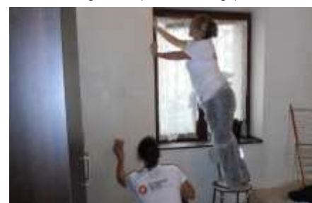
2 bénévoles de la fondation Somfy – Oullins