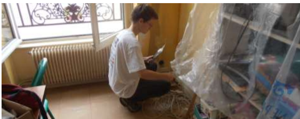
Volontaire chantier Lyon 1er

2013 est la 2 ème année d'accueil de jeunes volontaires en service civique. Ils sont désormais trois, de France et d'Allemagne, logés par l'association, à participer aux chantiers d'ARA, à la dynamique collective et solidaire des projets, à la vie associative des CBRA et du réseau Compagnons Bâtisseurs (participation aux instances régionales et nationales, stage des volontaires, mobilité dans d'autres associations régionales ...). Leur implication, leur jeunesse et leur enthousiasme constituent une véritable valeur ajoutée pour l'équipe et les projets.