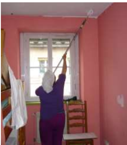
Une bénéficiaire sur son chantier – Lyon