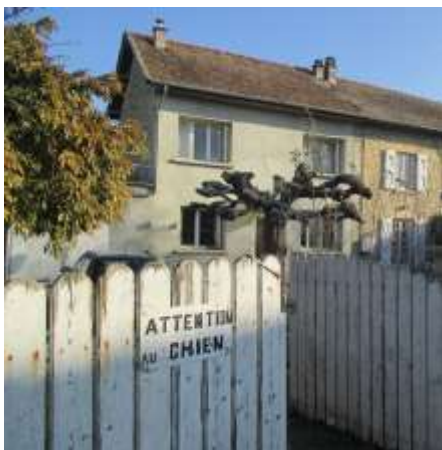
Projet de chantier du « Marais des mûres »